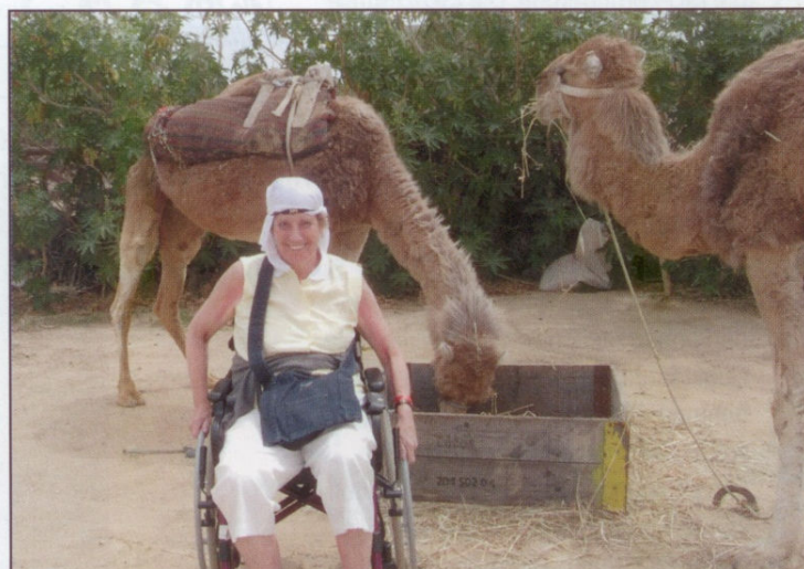
Die Pflegenden lernen die ihnen anvertrauten Bewohner im Urlaub von einer anderen Seite kennen.

Der Pflegeschlüssel bei den Urlaubsreisen des Alpenparks liegt bei 1:1. Dazu kommt noch eine Kraft, die die Reise leitet und gegebenenfalls als „Springer“ fungiert. Das Team setzt sich multiprofessionell zusammen und es wird bei den Begleitpersonen natürlich auch darauf geachtet, dass ein Bezug zum Bewohner bereits vor Abreise gelebt wird. In einzelnen Fällen – falls der Wunsch geäußert wird – dürfen sich natürlich auch Angehörige den Reisen anschließen! Gerade bei Ehepaaren kann ein gemeinsamer Urlaub auch die Beziehung zueinander wieder intensivieren,