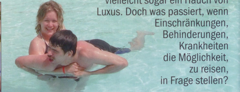
Das Beispiel des Alpenparks zeigt, dass auch mit Hirngeschädigten ein Urlaub möglich ist.

Im Alpenpark, einem Zentrum für Rehabilitation und Pflege in Kiefersfelden, hat man vor elf Jahren angefangen, dieses Thema aufzugreifen: nicht in langen theoretischen Besprechungen oder Diskussionen, sondern direkt im Gespräch mit den Bewohnern. Letztendlich haben die Wünsche der Menschen, die dort leben, das Handeln bestimmt. Und genau so lange verweilt das Team des Alpenparks mit seinen Bewohnern – zuerst einmal im Jahr, nach steigender Nachfrage wird nun seit sechs Jahren bereits zweimal im Jahr geplant.