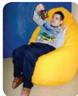
Handelsübliche Sitzsäcke können in verschiedener Form als Lagerungselement eingesetzt werden