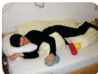
Formverändernde und geräuschproduzierende Materialien geben ein schnelles Feedback und fordern somit zur Aktivität auf