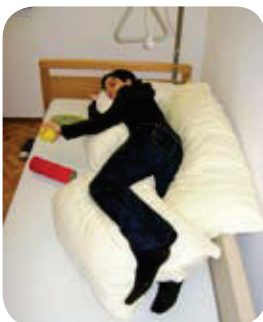
Seitlagerung direkt am Bettgitter schafft mehr Greif-/Spielraum