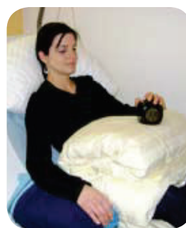
Beim Berühren des Würfels werden Uhrzeit und Datum angesagt